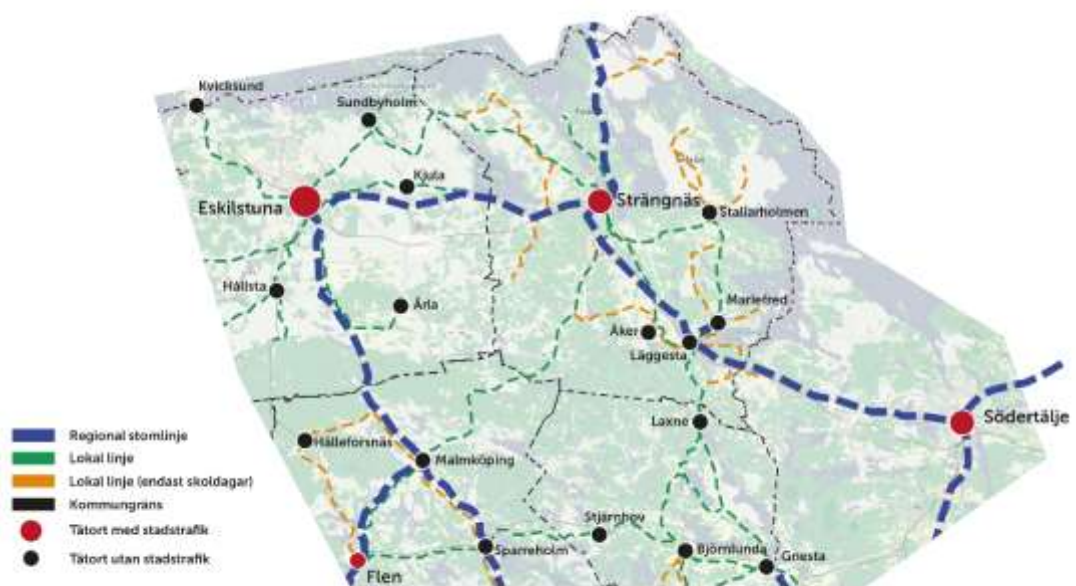
Figur 1. Kollektivtrafik i området

Stadstrafik finns i Strängnäs tätort. Landsbygdstrafiken består av regionala stomlinjer och lokala linjer. Regional stomlinjetrafik förbinder länets kommunhuvudorter. De lokala linjerna körs i huvudsak inom kommunen varav flera linjer endast trafikeras under skoldagar. Vissa linjer är delvis anropsstyrda, vilket innebär att resenären på förhand måste ringa och boka sin resa. I en del områden med mer än två kilometer till närmaste hållplats finns kompletteringstrafik.